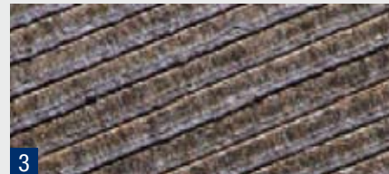
Neuer optimierter Backlack, ohne Lackaustritt